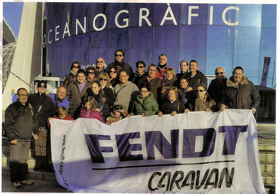
Imagen del grupo en la Ciudad de las Artes y las Ciencias de Valencia.